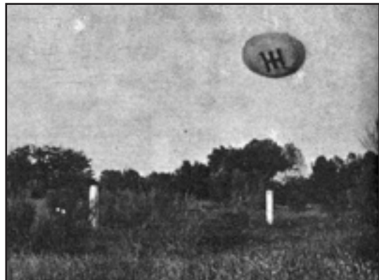
Foto del OVNI de San José de Valderas

Aplicando la navaja de Occam, discrepo. Tengo una experiencia personal con un caso similar ocurrido en mi localidad hace más de veinte años, también con un supuesto OVNI fotografiado y visto por bastantes testigos. Y casualmente, el propio Benítez, tuvo un papel nada comedido en la divulgación nacional del fraude. Cualquier interesado puede leer mi informe para Cuadernos de Ufología (1ª Época) 10-11 pp. 67-71.